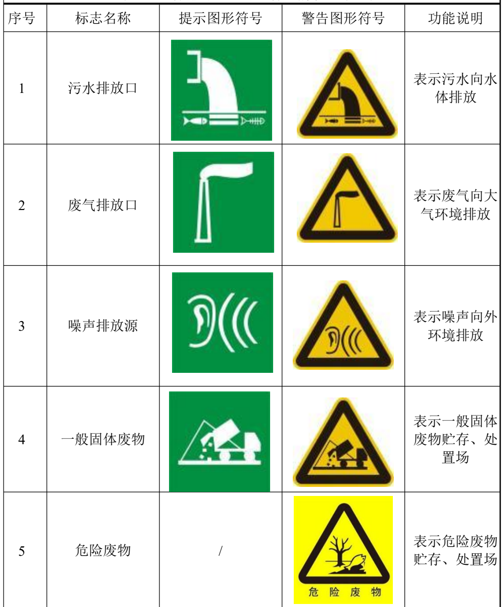
表 5-1 各排污口(源)标志牌设置示意图